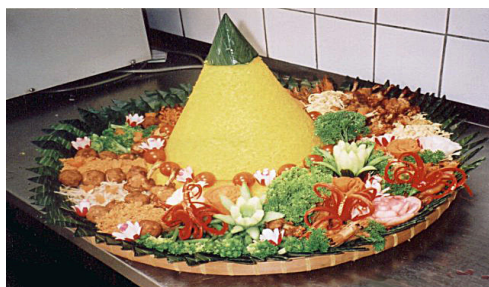
Gambar 3 Nasi Tumpeng. Foto yang diambil oleh dan milik Taufik Thoyib dan Joyce, “Tumpeng Wikipedia,” 18 Maret 2018, diakses 30 April 2018, https://en.wikipedia.org/wiki/Tumpeng .

A.P. Jati, peneliti Teknologi Pangan Jurusan Widya Mandala Universitas Katolik Surabaya, menyebutkan bahwa “jumlah lauk biasanya tujuh (dalam bahasa Jawa: pitu ) berasal dari kata Pitulungan , Yang artinya bantuan.” 33 Jenis lauk pauk harus mewakili tiga elemen: (1) hewan yang hidup di darat, seperti ayam, telur, dan daging sapi; (2) hewan yang hidup di air, seperti bandeng, lele, ikan teri; dan (3) sayuran, seperti kubis rawa, wortel, kubis, kacang panjang, dan bayam (lihat gambar 1). 34