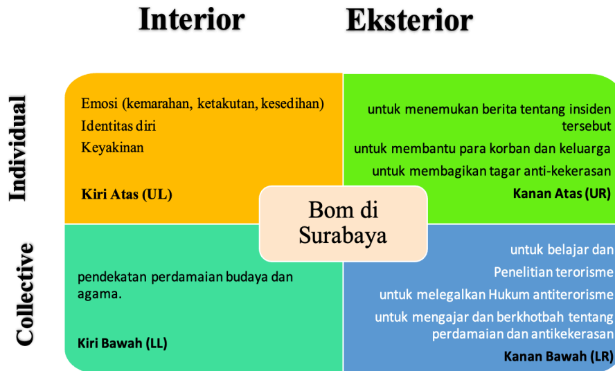
Gambar 2 Integral Frame Theory: dalam kasus pelaku bom bunuh diri menyerang tiga gereja di Indonesia.

Dalam konteks Indonesia, penulis percaya bahwa “negative peace” bukanlah cara yang baik untuk membangun perdamaian. Sejarah konflik di Indonesia, sejak era kolonial, telah membuktikan bahwa kekerasan, negosiasi, dan kekuatan militer tidak pernah berhasil membangun perdamaian. Bahkan jika pendekatan itu tampaknya berhasil mencegah atau menghentikan konflik, benih-benih konflik masih tetap ada di dalam masyarakat. Oleh karena itu, pendekatan “positive peace” dan nonviolence , menurut penulis, adalah cara terbaik untuk membangun perdamaian di Indonesia. Pengelolaan terhadap kedua pendekatan tersebut dapat dilakukan pada komunitas akar rumput dengan menggunakan tradisi lokal. Karena itu, pada bagian selanjutnya dari makalah ini, penulis membahas salah satu tradisi lokal Indonesia, yaitu tradisi makan tumpeng, sebagai salah satu contoh dari serangkaian upaya perdamaian dengan pendekatan positif dan tanpa kekerasan.