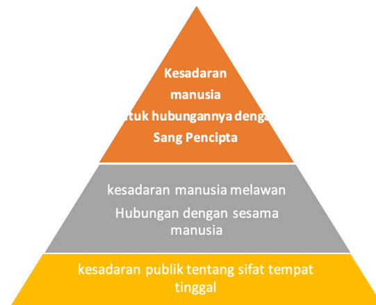
Gambar 4 Tiga simbol relasional dari tradisi makan Nasi Tumpeng. Nanny Sri Lestari, "Nasi Tumpeng, a Way to Convey the Message through Meaningful Signs," International Review of Humanities Studies 1, no. 1, January 2016, 45, diakses 21 Februari 2018.